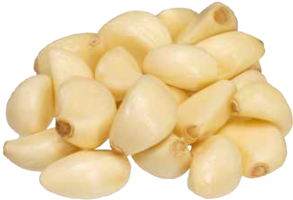
KNOBLAUCH GESCHÄLT 1 Krt. = 10 Pkg., 1 kg, 3773173