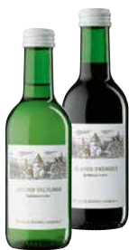
WINZER KREMS "MINIBAR" versch. Sorten 1 Krt. = 12 Fl., 0,25 l