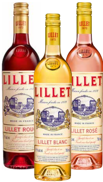
LILLET Frankreich versch. Sorten 1 Krt. = 6 Fl., 0,75 l