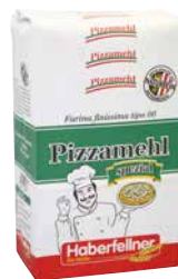
HABERFELLNER PIZZAMEHL Type 700 1 Krt. = 2 Pkg., 5 kg, 820860