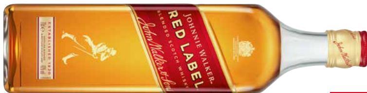
JOHNNIE WALKER RED LABEL aus Schottland 1 Krt. = 6 Fl., 0,7 l, 55699