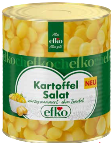
EFKO KARTOFFEL SALAT 1 Stk., 3 l, 3767001