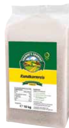
FARMERS COUNTRY RUNDKORNREIS 1 Pkg., 10 kg, 804799