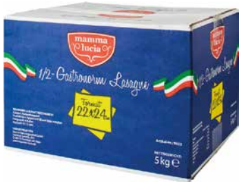
MAMMA LUCIA LASAGNE GELB 22 x 24 cm 1 Krt., 5 kg, 3320561