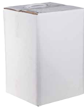
DOCKNER WEISSWEIN BIB 1 Stk., 20 l, 1899475