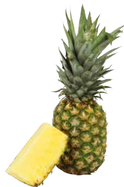
ANANAS KL.1 1 Krt. = 9 Stk., 1642974