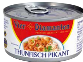
4-DIAMANTEN THUNFISCH versch. Sorten 1 Krt. = 24 Stk., 185 g