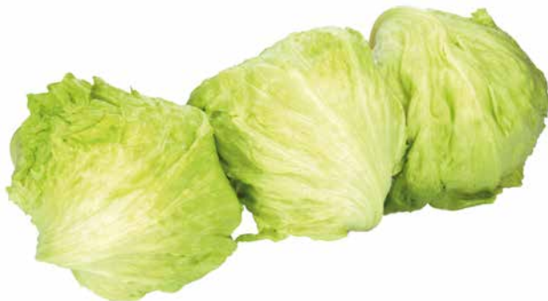
EISBERGSALAT KL.1 1 Krt. = 10 Stk., 622530