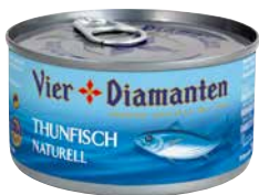
4-DIAMANTEN THUNFISCH versch. Sorten 1 Krt., 195 g