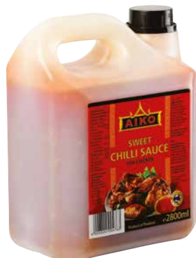
AIKO SWEET CHILI SAUCE 1 Krt. = 4 Stk., 2,8 l, 3012622