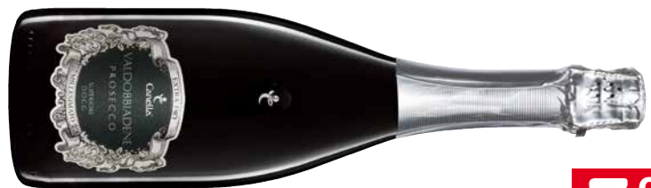
CANELLA PROSECCO SPUMANTE SUPERIORE DOCG Italien 1 Krt. = 6 Fl., 0,75 l, 402974