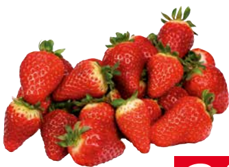
ERDBEEREN KL.1 1 Krt. = 10 Pkg., 500 g, 6304