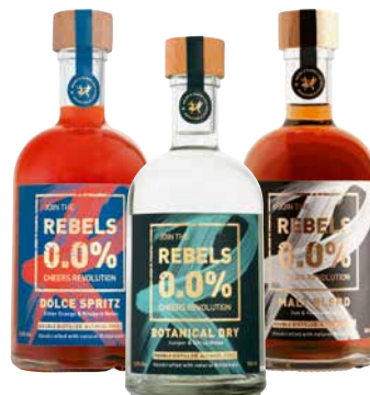
REBELS 0,0% versch. Sorten 1 Krt. = 6 Fl., 0,5 l