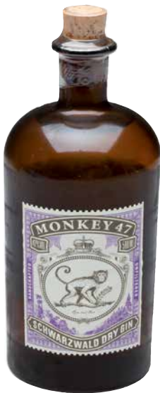
MONKEY 47 SCHWARZWALD DRY GIN aus Deutschland 1 Krt. = 6 Fl., 0,5 l, 1266048