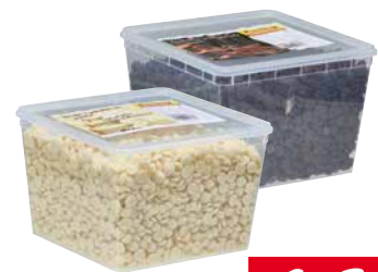
FREUDENSCHUSS SCHOKOLINSEN versch. Sorten 1 Pkg., 2,5 kg