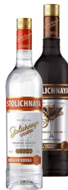
STOLICHNAYA VODKA versch. Sorten 1 Krt. = 6 Fl., 0,7 l