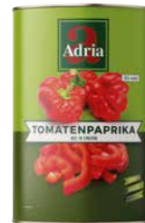
ADRIA TOMATENPAPRIKA IN SCHEIBEN 1 Krt. = 6 Stk., 5/1, 3378718