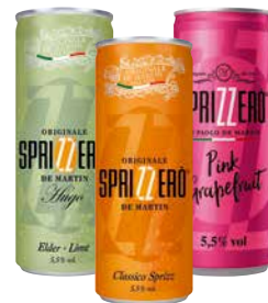
SPRIZZERO versch. Sorten 1 Krt. = 12 Stk., 0,250 l