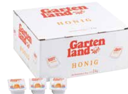
GARTENLAND BIENENHONIG PORTIONEN 1 Krt., 100 x 20 g, 911487