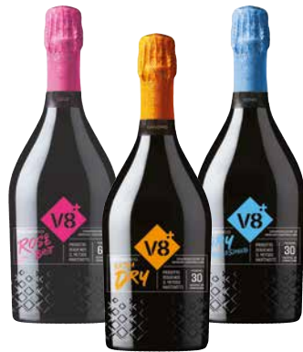
V8+ PROSECCO versch. Sorten 1 Krt. = 6 Fl., 0,75 l