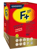
GOODFRY F+ FRITTIERFETT FLEX BiB 1 Stk., 15 l, 3494192