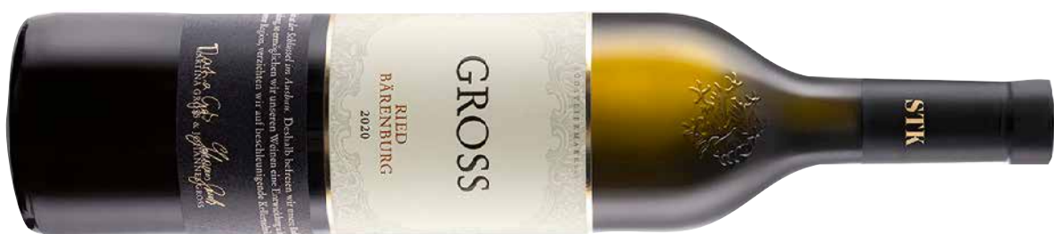
Gross Weißburgunder Ried Bärenburg Südsteiermark DAC 2020 1 Krt. = 6 Fl., 0,75 l, 3687464