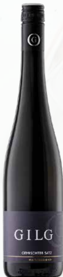
Gilg Gemischter Satz 2024 1 Krt. = 6 Fl., 0,75l, 3768892