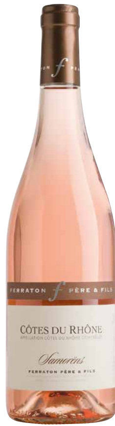
Ferraton Rosé Samorens 2023 Rhonetal 1 Krt. = 6 Fl., 0,75 l, 3639739