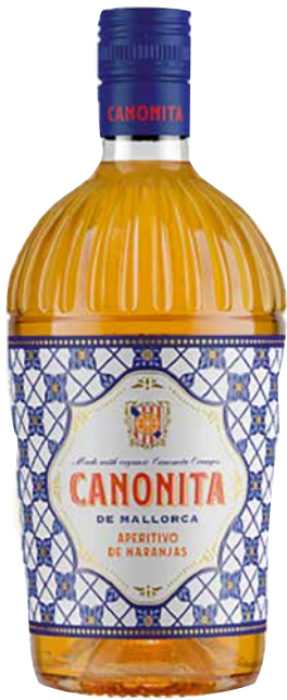
Canonita Aperitivo de Naranjas 18% 1 Krt. = 6 Fl., 0,75 l, 3557147