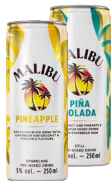
Malibu Ready To Drink versch. Sorten 1 Krt. = 12 Stk., 0,25 l