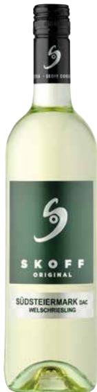
Skoff ORIGINAL Welschriesling Südsteiermark DAC 2024 1 Krt. = 6 Fl., 0,75 l, 3730249