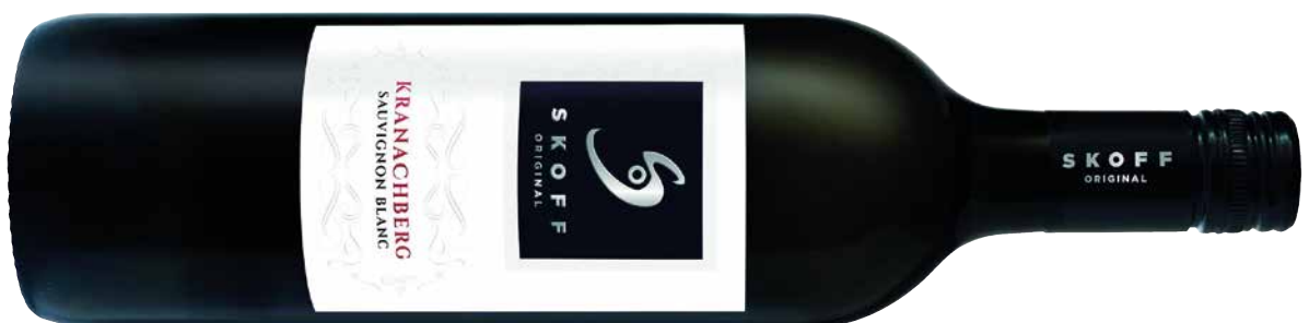
Skoff ORIGINAL Sauvignon Blanc Ried Kranachberg Südsteiermark DAC 2021 1 Krt. = 6 Fl., 0,75 l, 3637469