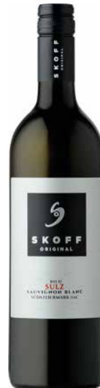
Skoff ORIGINAL Sauvignon Blanc Ried Sulz Südsteiermark DAC 2021 Südsteiermark 1 Krt. = 6 Fl., 0,75 l, 3525078