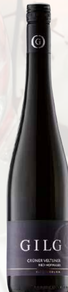
Gilg Grüner Veltliner Hagenbrunner Ried Hofmauer 2024 VINEUS Ed. 1 Krt. = 6 Fl., 0,75l, 3770799