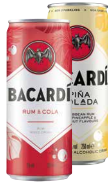
Bacardi Dosen versch. Sorten 1 Krt. = 12 Stk., 0,25 l