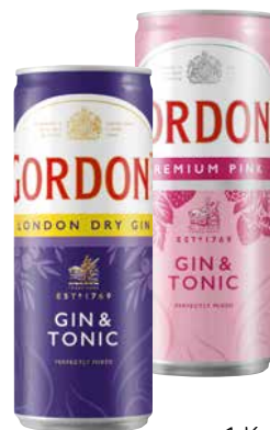
Gordon's Gin & Tonic versch. Sorten 1 Krt. = 12 Stk., 0,25 l