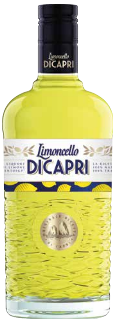
Limoncello di Capri aus Italien 1 Krt. = 6 Fl., 0,7 l, 1014315