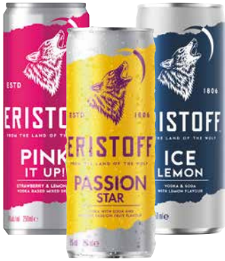
Eristoff Dosen versch. Sorten 1 Krt. = 12 Stk., 0,25 l