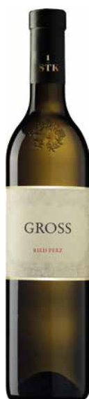
Gross Gelber Muskateller Ried Perz 2021 1 Krt. = 6 Fl., 0,75 l, 3736188