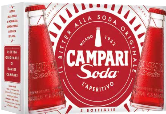
Campari Soda aus Italien 1 Krt. = 12 Pkg., 0,98 ml, 556662