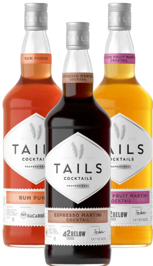
Tails Cocktails Ready to Drink 1 Krt. = 6 Fl., 1l