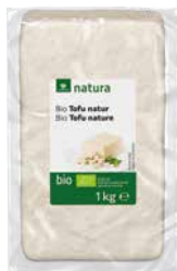
Natura Bio-Tofu-natur 1 kg Art.-Nr.: 3343431