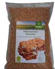
Veggy Star Erbsenprotein Granulat 1,5 kg Art.-Nr.: 3521614