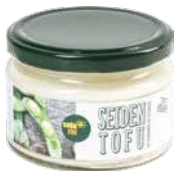
Feel Good Bio-Seidentofu im Glas 230 g Tofu wird aus Sojabohnen hergestellt, die in Wasser eingeweicht und anschließend zermahlen werden. Art.-Nr.: 3128790