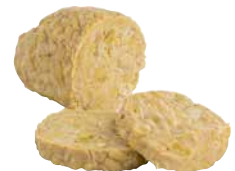
Tempeh Sojabohnen bio, fermentiert 200 g Art.-Nr.: 3614732