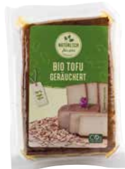
natürlich für uns Bio-Tofu-geräuchert 250 g Art.-Nr.: 1250992