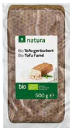
Natura Bio-Tofu-geräuchert 500 g Art.-Nr.: 3343449