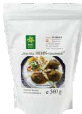
Veggy Star Soja-Mix, Huhn-Geschmack 560 g Art.-Nr.: 1709328