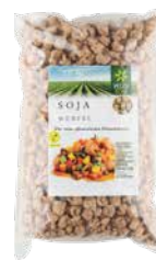
Veggy Star Soja-Würfel 1,5 kg Art.-Nr.: 1686955