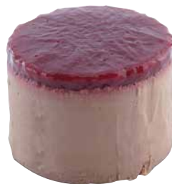
Göttinger Schokotrüffel-Creme auf Nussküchlein mit Himbeerfruchtmark 30 x 65 ml Art.-Nr.: 3585429