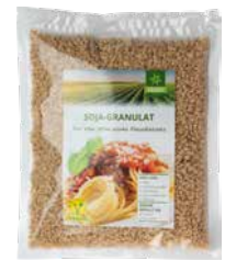
Veggy Star Soja-Naturgranulat 250 g Art.-Nr.: 3257292