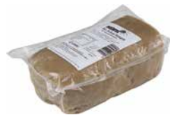
Feel Good Bio-Seitan 1 kg Art.-Nr.: 1664762