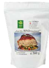
Veggy Star Soja-Mix, Rind-Geschmack 560 g Art.-Nr.: 1709294