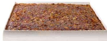
Göttinger Brownie 2 x 2.650 g Art.-Nr.: 3538691