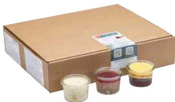
Göttinger Dessertselektion im Glas 12 x 80 g Art.-Nr.: 3538733