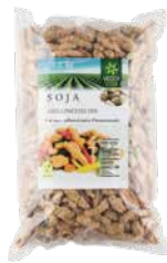
Veggy Star Soja-Geschnetzeltes 1,5 kg Art.-Nr.: 1686963