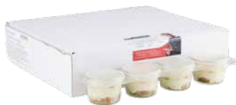
Göttinger Tiramisu im Glas 12 x 55 g Art.-Nr.: 1489814