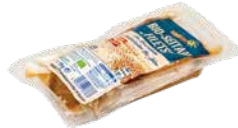
Feel Good Bio-Seitanfilet 250 g Bio-Seitan ist eine wertvolle pflanzliche Eiweißquelle und kann auf eine lange eigenständige Tradition zurückblicken. Seitan ist unkompliziert und schnell zuzubereiten. Art.-Nr.: 1250976