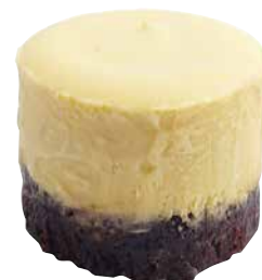
Göttinger Mangocreme Schokokuchen 30 x 65 ml Art.-Nr.: 3585452