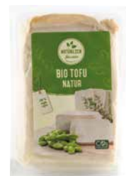
natürlich für uns Bio-Tofu-natur 250 g Art.-Nr.: 1250877