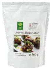
Veggy Star Soja-Mix, Burger 560 g Art.-Nr.: 1709310