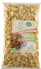
Natürlich Leben Bio-Soja- Geschnetzeltes 500 g Art.-Nr.: 3475712