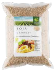
Veggy Star Soja-Granulat 1,5 kg Art.-Nr.: 1686930